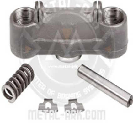
1001-KALİPER ŞAFT YUVASI SETİ