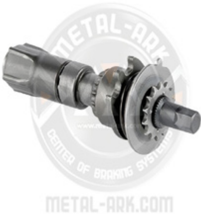
1005-KALİPER AYAR MEKANİZMASI -RULMANLI