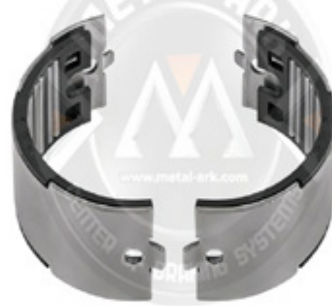
1021-KALİPER İĞNELİ RULMAN SETİ