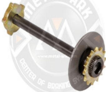
1022-KNORR KALİPER AYAR MEKANİZMASI KARŞI DİŞLİ