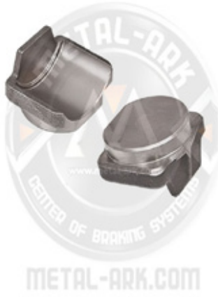
5007-KALİPER YARIMAY RULMAN YATAĞI SETİ