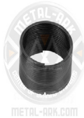
2300-06-MEKANİZMA BURULMA YAYI