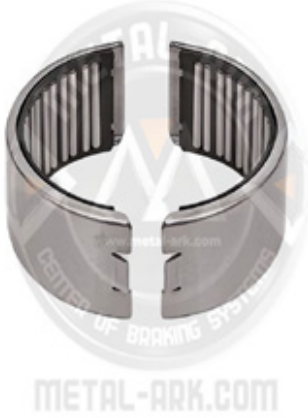
1003-KALİPER YARIMAY RULMAN SETİ