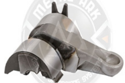
1015-KALİPER HAREKET KOLU