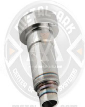
2300-02-KALİPER AYAR MEKANİZMA KOVANI