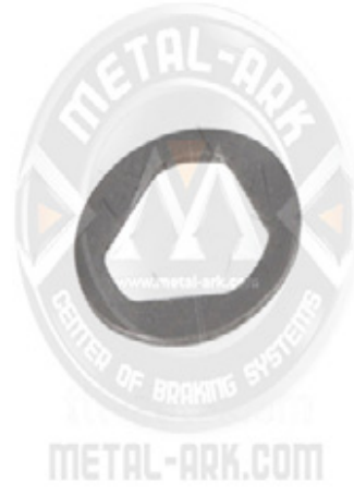
2200-08-MEKANİZMA ÜÇGEN PULU