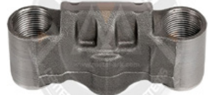
1019-KALİPER SAFT YUVASI