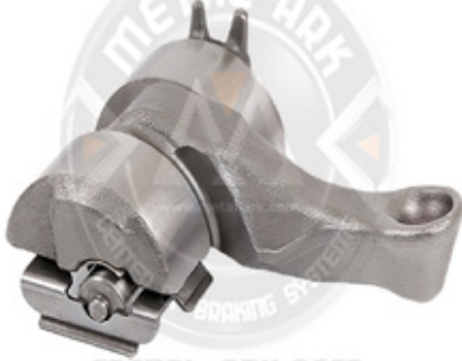
1020-KALİPER HAREKET KOLU