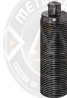
1023-KALİPER AYAR MEKANİZMA CİVATASI