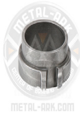
2300-04-MEKANİZMA BURULMA YAY HALKASI BÜYÜK