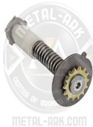
1006-KALİPER AYAR MEKANİZMASI KARŞI DİŞLİ