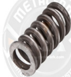
1010-KALİPER ŞAFT YUVASI YAYI