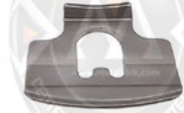
1009-KALİPER ŞAFT YUVASI SACI