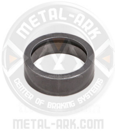
2300-05-MEKANİZMA BURULMA YAY HALKASI KÜÇÜK