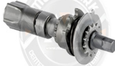
1005-KALİPER AYAR MEKANİZMASI -RULMANLI