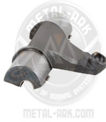
5008-KALİPER HAREKET KOLU