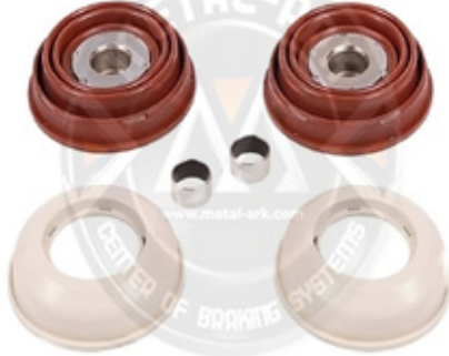
1013-KALİPER İTENEK VE TOZ KÖRÜĞÜ SETİ