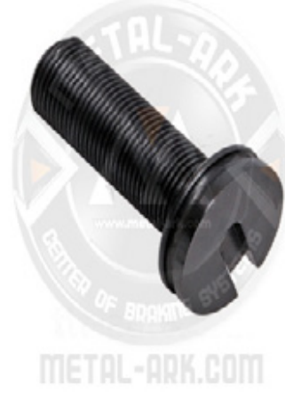
2000-08-KALİPER AYAR CİVATASI - 87 MM (YAR-GILI)