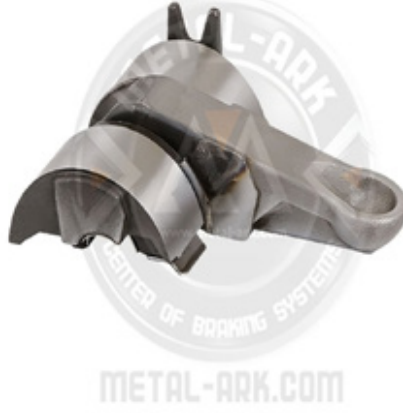
1002-KALİPER HAREKET KOLU