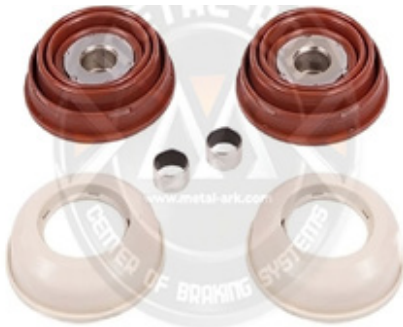
1018-KALİPER İTİCİ VE KÖRÜK TAKIMI