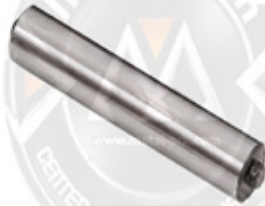
1008-KALİPER HAREKET KOLU MİLİ