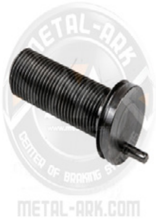
2300-03-KALİPER AYAR CİVATASI