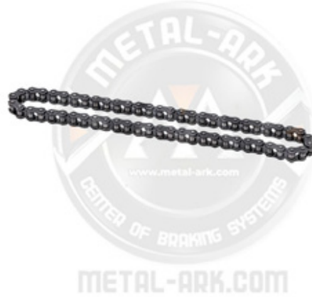
1004-KALİPER AYAR MEKANİZMA ZİNCİRİ