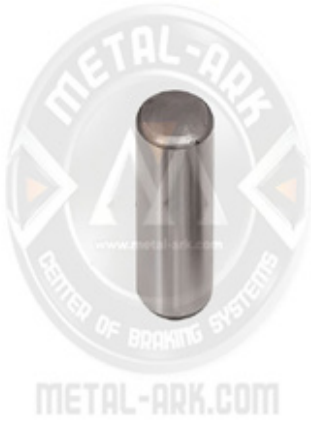
5009-KALİPER HAREKET KOLU TANE RULMANI