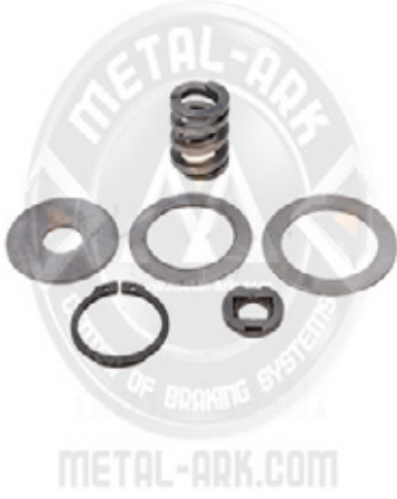
2000-07-KALİPER AYAR MEKANİZMA PULU VE YAY SETİ