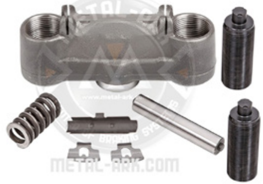
1014-KALİPER SAFT YUVASI